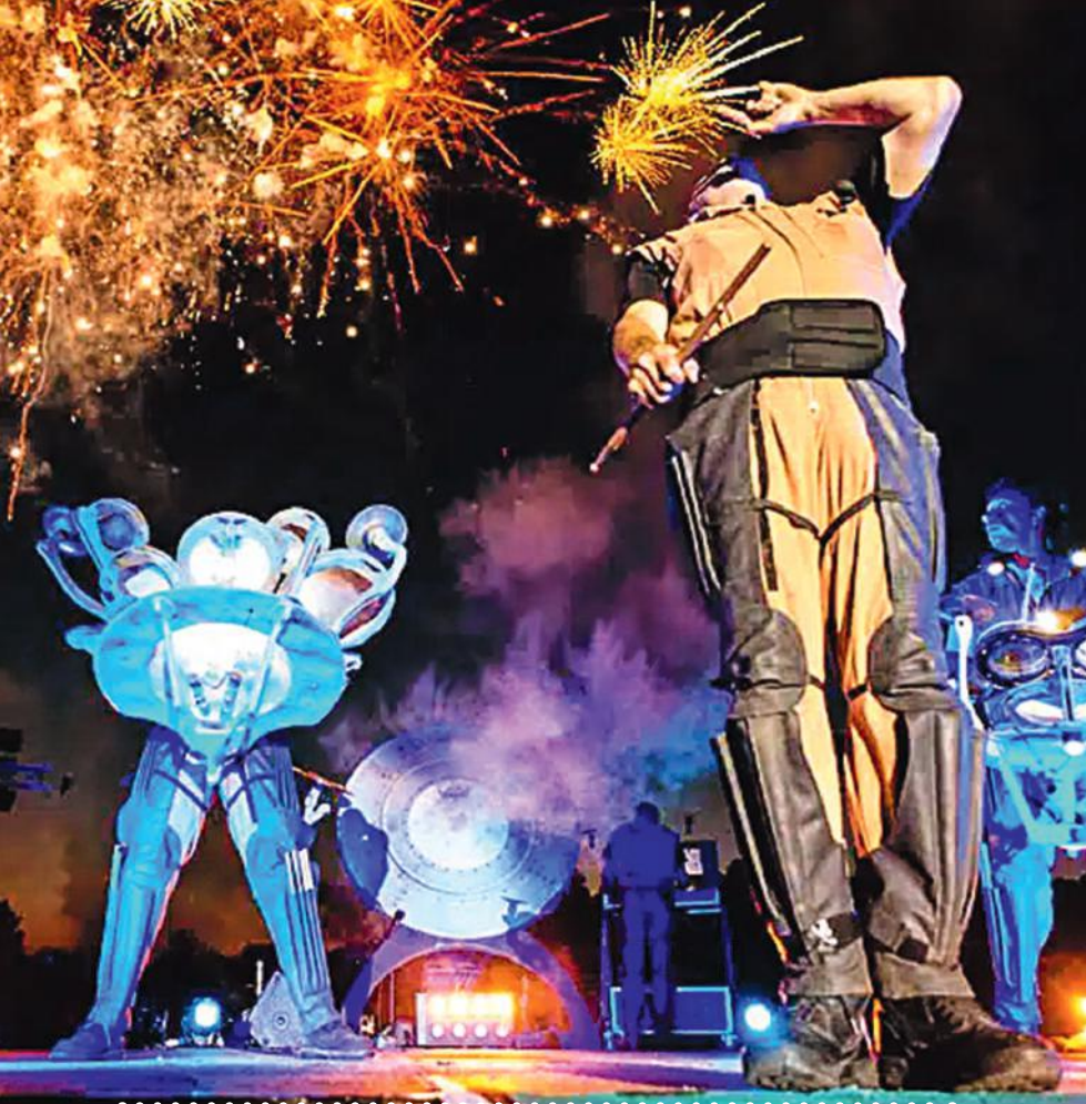
Les Commandos Percu, un spectacle saisissant qui mêle percussions et pyrotechnie. Le 19 août à Bayonne!