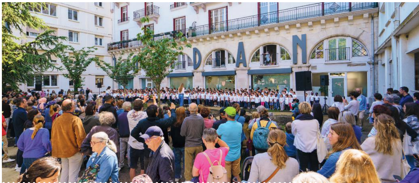
Plus de 300 élèves ont rendu hommage aux femmes de la Résistance. Une initiative qui a rempli d'émotions, de souvenirs et de fierté les familles présentes

Plus de 300 écoliers bayonnais ont rendu hommage aux Résistantes du Pays Basque, le 26 mai dernier, autour de la place qui leur est dédiée