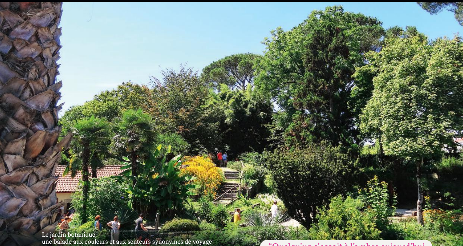
Le jardin botanique, une balade aux couleurs et aux senteurs synonymes de voyage

“Quelqu’un s’assoit à l’ombre aujourd’hui