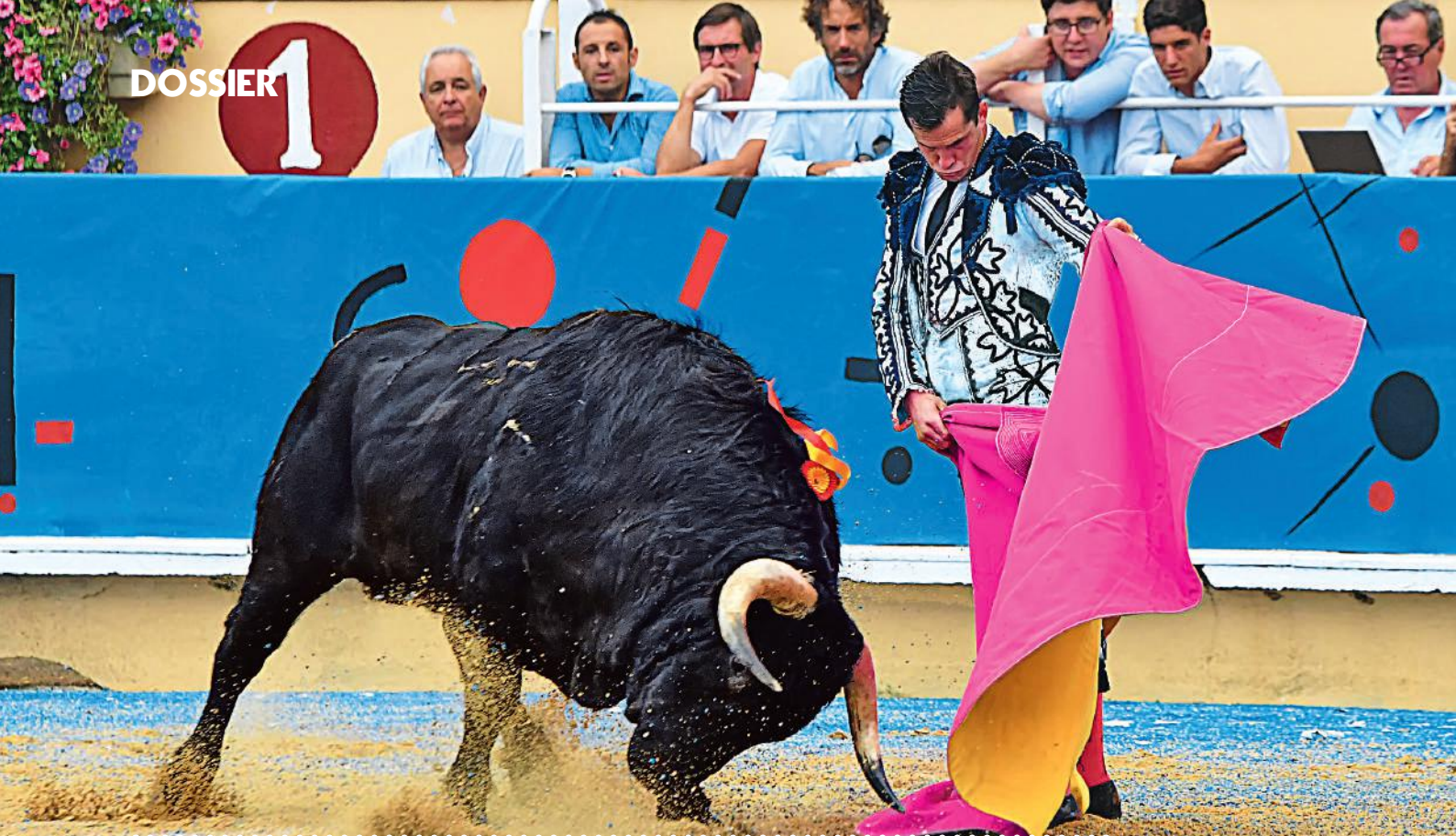
Daniel Luque, à l'affiche le 3 septembre. En photo, seul en piste lors de la corrida goyescque de 2019, face à six taureaux, la star espagnole avait coupé quatre oreilles et une queue