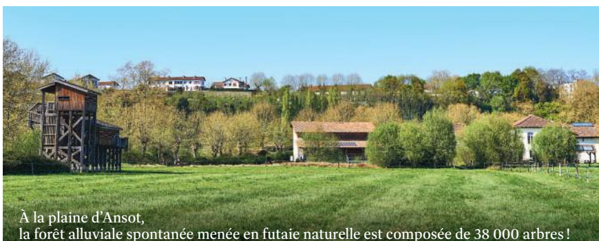
À la plaine d'Ansot, la forêt alluviale spontanée menée en futaie naturelle est composée de 38 000 arbres !

Zone naturelle protégée de 100 hectares, la plaine d'Ansot permet de découvrir la richesse des écosystèmes spécifiques aux zones humides à travers des sentiers pédagogiques à thème. Les différentes formations végétales telles que les prairies humides, les roselières, les herbiers aquatiques des étangs et des cours y sont présents. La strate végétale la plus élevée du site concerne les arbres organisés autour de près de 38 000 sujets et 26 espèces autochtones. Les arbres d'alignement,