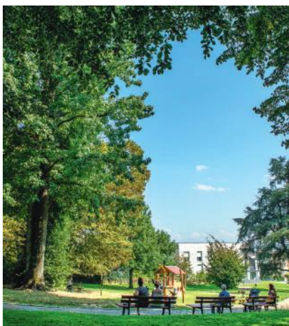
Le parc de Caradoc, un havre de paix et un point de vue exceptionnel sur Bayonne et les Pyrénées

également les érables japonais à proximité de la collection d'agapanthes, la roseraie, les pommiers taillés en cordon ou palmette et, bien sûr, le magnifique magnolia grandiflora "Caradoc", sujet remarquable planté en 1860. Ce parc atypique, tout en courbes et en pentes, est un havre de paix qui offre un point de vue exceptionnel sur Bayonne et les Pyrénées. Des aires de jeux pour les enfants y ont récemment été installées.