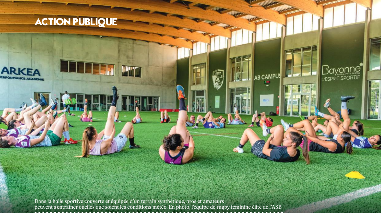
Dans la halle sportive couverte et équipée d'un terrain synthétique, pros et amateurs peuvent s'entraîner quelles que soient les conditions météo. En photo, l'équipe de rugby féminine élite de l'ASB