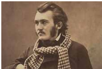
Gustave Doré par Félix Nadar (1855-1859)

Expositions à consulter sur le site de la médiathèque