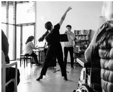
Art et handicap