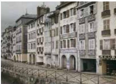
Auguste Léon - Bayonne, le quai Galupérie (détail) 1924

Conçue avec le Musée Basque de Bilbao, l'exposition propose une sélection d'images en couleurs inédites, des années 1910 à 1930, qui retracent la diffusion et l'impact du procédé des autochromes de part et d'autre de la frontière.